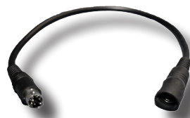
VA-000167 Adapterkabel zum Anschluss von 4 Pin Kameras an 6 Pin Monitore